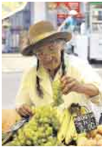
VIDA ÚTIL. A pesar de los años, siguen laborando.

Esa cifra, extraída de los datos que arrojó el Censo Nacional de Población y Vivienda que el año pasado llevó a cabo el Instituto Nacional de Estadística e Informática (INEI), representa el 33,6% de la población de 60 años a más, considerada por la entidad estadística dentro del rubro de población en edad de trabajar (habitantes de 14 años a más).